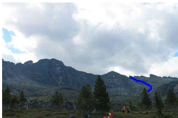
Фото № 11. Путь подъема на пер. Восточный 1А