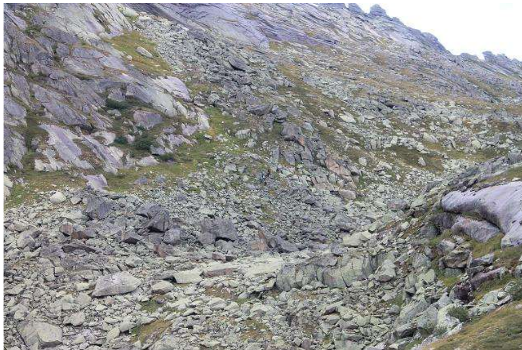
Фото № 23. Восточный склон пер. Восточный 1А (начало взлётной части)

Пройден 17-го августа 2012 г. с востока на запад. Время подъема по восточной взлётной части 50 мин. Полное время прохождения перевала 4 ч. 45 мин.