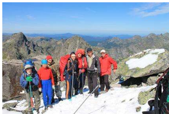
Фото № 17. Группа на пер. Птица 1А