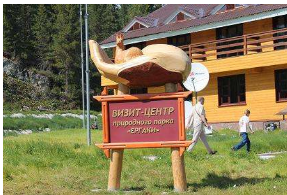
Фото № 1. Визит-центр природного парка «Ергаки»

Ужин приготовили на костре, который проще всего оказалось развести прямо на тропе.