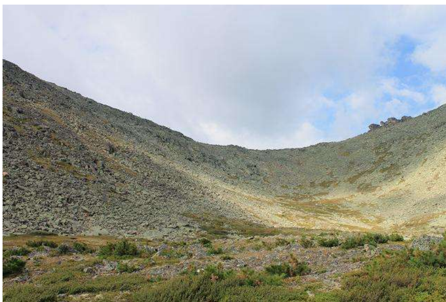
Фото № 19. Взлётная часть восточного склона пер. Кедровый 1А

Категория трудности 1А. Высота н.у.м. по классификатору 2000 м. Характер травянисто-осыпной. Ориентирован восток – запад. Расположен в средней части хребта Метугул-Тайга. Соединяет долину оз. Буйбинское и истоки р. Прямой Тайгиш Определяющие стороны обе. Седловина каменная, протяжённая, шириной более 50 м. Протяжённость взлётной части восточного склона 500 м., набор высоты 150 м. Протяжённость спуска по западному склону 700 м.