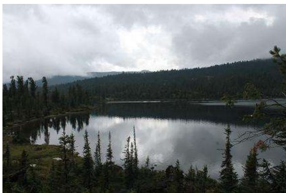
Фото № 8. Озеро Бол. Буйбинское (точка съемки в средней части восточного побережья)

В лагерь вернулись в 13-15. После обеда в 15-40 вышли в сторону пер. Восточный 1А. Подъём начали сразу с северной оконечности оз. Бол. Буйбинское. К 17-30 вышли на озерцо у скального выступа под перевалом. Мест для палаток на открытой площадке много, т.к. уклон небольшой. Однако это место может очень сильно продуваться, что и произошло у нас ночью. Рекомендуем делать ночлег раньше, не поднимаясь до озерца.