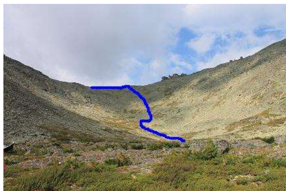
Фото № 6. Путь подъема по восточному склону на пер. Кедровый 1А (с точки перед взлётной частью)

До оз. Бол. Буйбинское добрались в 17-00. У Евгения Синцова поднялась температура. Вероятнее всего, причиной послужила непогода – приходилось много идти под дождем. Дали таблеток аспирина. Легли спать в 21-00.