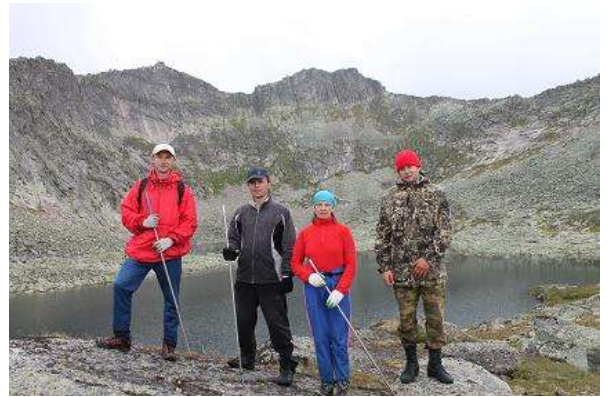
Фото № 14. Группа у оз. Двойное