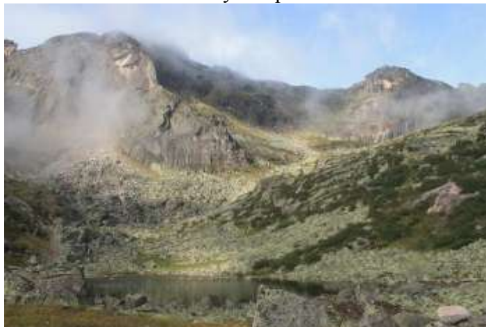
Фото № 10. Озерцо перед пер. Восточный 1А (вид с места стоянки)

Расположились на тропе для обеда. Пообедали и пошли вдоль ручья до р. Левый Тайгиш. После спуска пошли по тропе вверх по течению вдоль правого берега реки в сторону оз. Художников. Встали на стоянку «Стрелка» в 16-50.