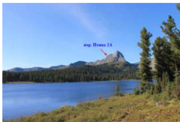
Фото № 26. Вид на южный склон пер. Птица 1А (с восточного побережья оз. Светлое)

Пройден 20-го августа 2012 г. с севера на юг.