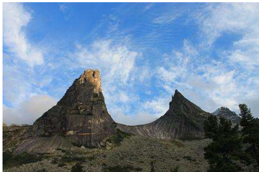
Фото № 15. У Параболы

Пообедали. На полчаса вышло солнце, что позволило нам подсушиться. Легли спать в 21-00.