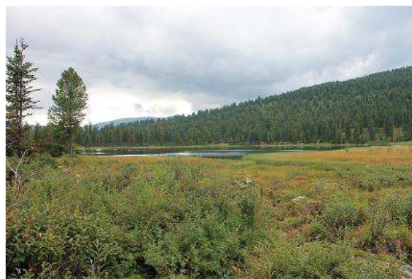
Фото № 9. Озеро Мал. Безрыбное (с западной оконечности)