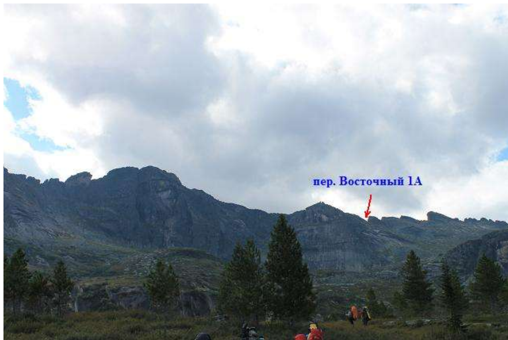
Фото № 22. Вид на восточный склон пер. Восточный 1А (после подъема от оз. Бол. Буйбинское)