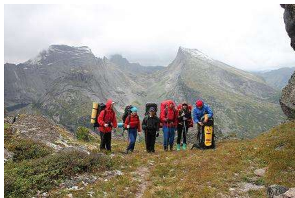
Фото № 12. Группа на пер. Восточный 1А