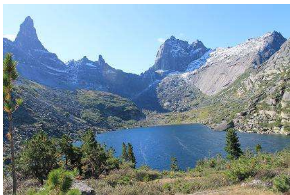
Фото № 16. Озеро Горных Духов

Приготовили выходной торт. Легли спать в 22-00.