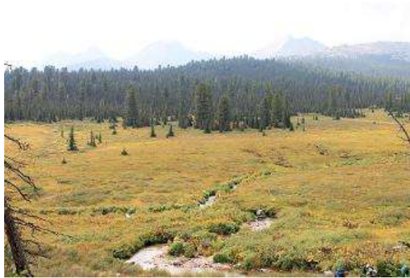
Фото № 3. Река Ср. Буйба в верхнем течении