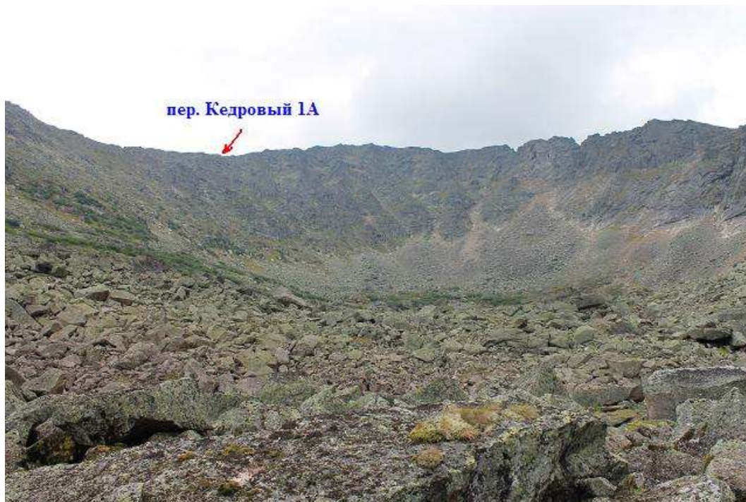
Фото № 21. Спуск с седловины пер. Кедровый 1А. Вид на западный склон

Пройден 15-го августа 2012 г. с востока на запад. Время подъема по взлётной части восточного склона 30 мин. Полное время прохождения перевала 2 ч. 10 мин.