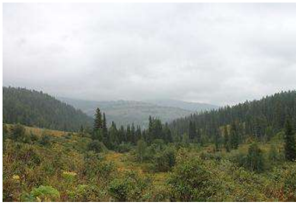
Фото № 2. Вид на хребет Метугул-Тайга (на заднем плане) в месте брода р. Золотой Ключ