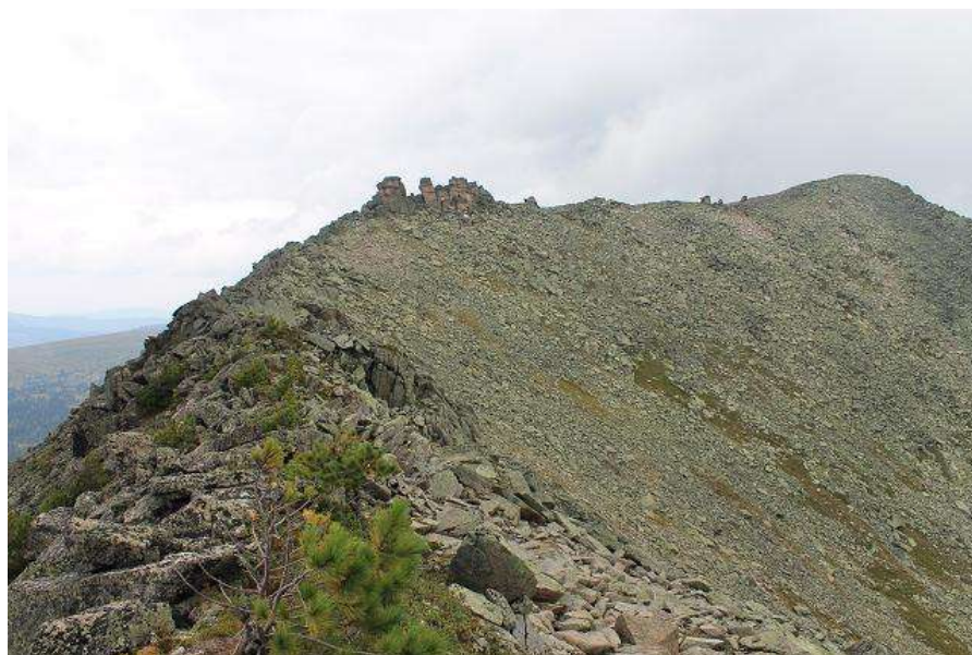
Фото № 20. Седловина пер. Кедровый 1А. Вид на север