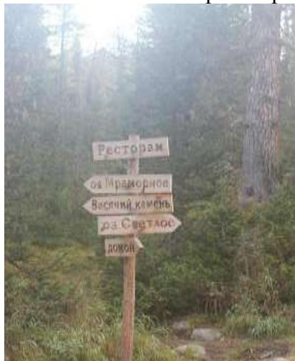
Фото № 18. Указатель на пути вдоль р. Тушканчик

Вышли в 9-00. Обогнули оз. Светлое вдоль восточного берега и вышли к р. Тушканчик. Спустились вдоль левого берега ручья до автотрассы к 12-00. Пообедали. В 12-30 подошёл автобус и в 13-30 мы выехали в г. Красноярск.