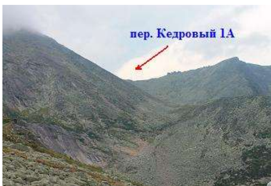
Фото № 5. Подход к пер. Кедровый 1А со стороны оз. Буйбинское