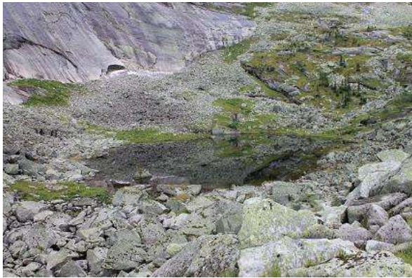
Фото № 13. Озеро Чёрное (вид с тропы, уходящей к оз. Двойное)

Вернулись в лагерь в 14-30, перейдя р. Левый Тайгиш вброд.