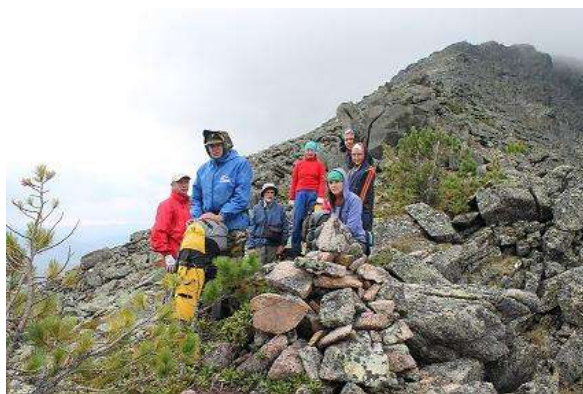
Фото № 7. Группа на пер. Кедровый 1А (вид на юг)